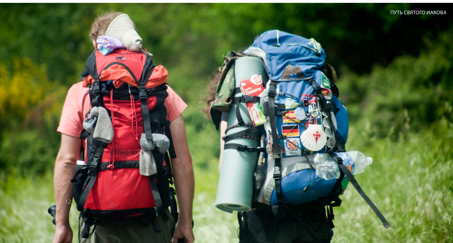
ПУТЬ СВЯТОГО ИАКОВА

Осень — это идеальное время для знакомства с центром этого сообщества, ведь именно тогда такие очаровательные городки, как Олите , отмечают праздник сбора урожая и проводят мероприятия, связанные с вином, состязания с быками и парады повозок, и при этом повсюду звучит музыка.