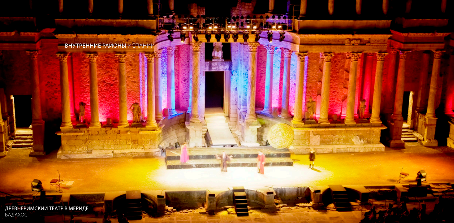
ДРЕВНЕРИМСКИЙ ТЕАТР В МЕРИДЕ БАДАХОС

Если вам нравится инди-музыка, закажите билеты на независимый мадридский фестиваль Festimad , который проходит в апреле. Каждый год на фестивале выступают самые актуальные музыкальные группы. Кроме того, фестиваль служит платформой для начинающих групп. В какое бы время вы ни приехали, культурная программа Мадрида не оставит вас равнодушным. Вас ждет много интересного — от больших театров, где вы сможете увидеть самые известные мюзиклы, до самых современных культурных центров, таких как « Матадеро ».