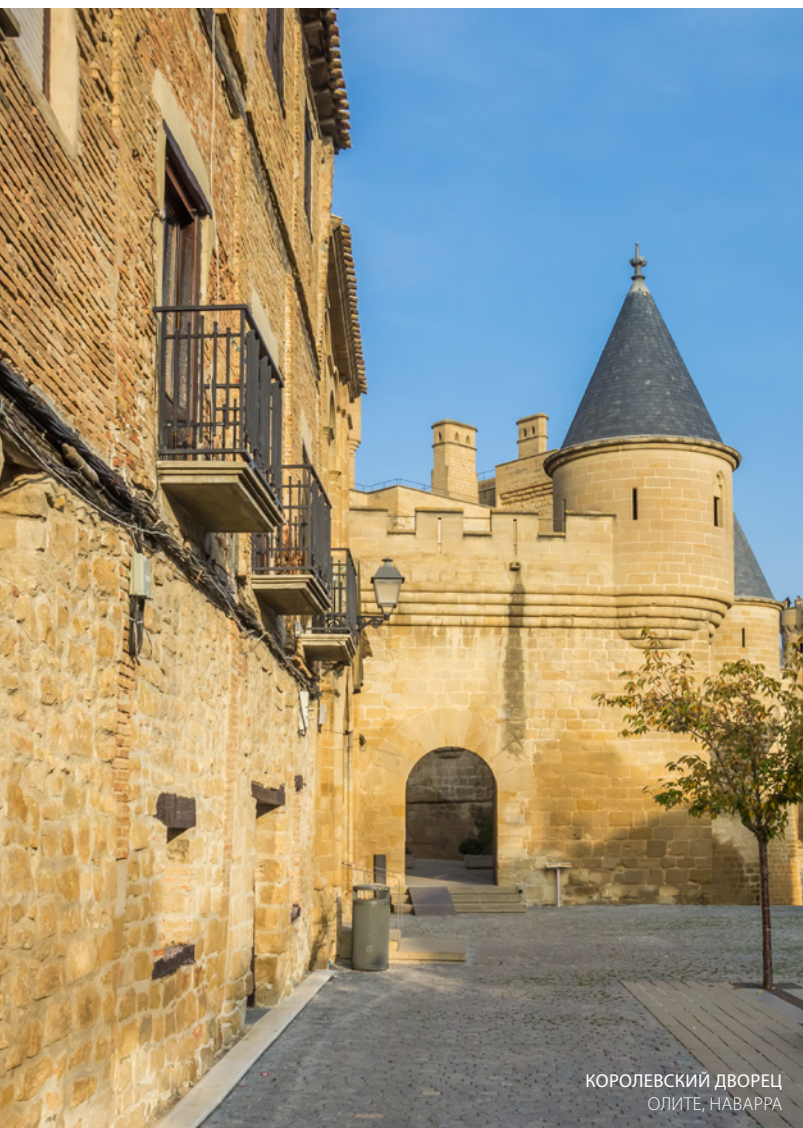
КОРОЛЕВСКИЙ ДВОРЕЦ ОЛИТЕ, НАВАРРА