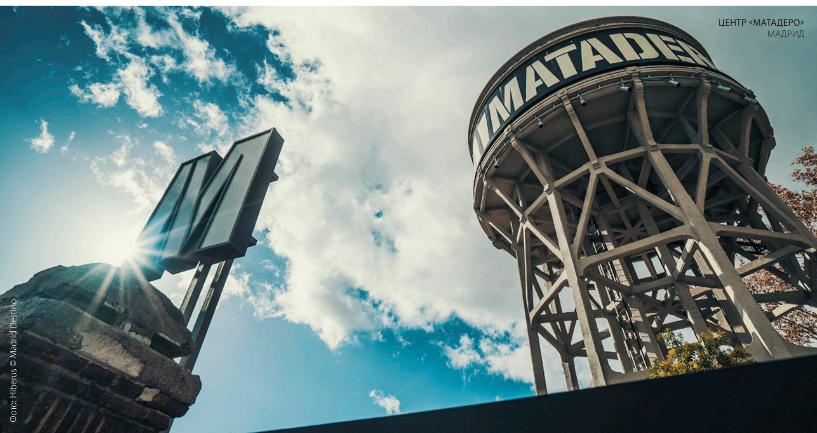
ЦЕНТР «МАТАДЕРО» МАДРИД

Музыка, театр, кино... Внутренние районы Испании предлагают разнообразную культурную программу, которая будет вам интересна. Вот некоторые идеи. В начале января в Логроньо (Риоха) проходит первый большой фестиваль в культурном календаре Испании. Он называется «Актуальный ландшафт современных культур» и предлагает большое количество концертов, театральных постановок, кинопремьер и выставок. В марте Памплона (Наварра) превращается в мировой центр документального кино благодаря Международному фестивалю документального кино «Точка зрения» . Показы проходят в различных местах города и предназначены для самой разной аудитории.