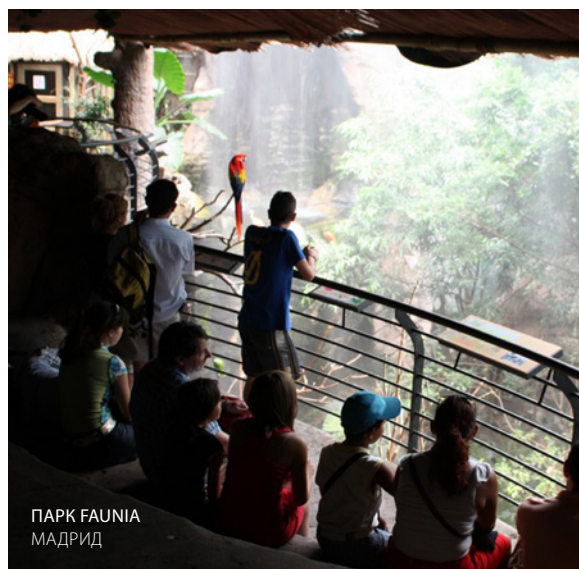
ПАРК FAUNIA МАДРИД

Еще одно увлекательное мероприятие — это путешествие по маршруту следов динозавров в Сории (Кастилия-и-Леон). Здесь вы увидите окаменевшие следы этих гигантских животных и сможете посетить палеонтологические музеи, центры и уроки. Вы готовы пробудить в себе исследователя? В палеонтологическом парке приключений « Затерянное