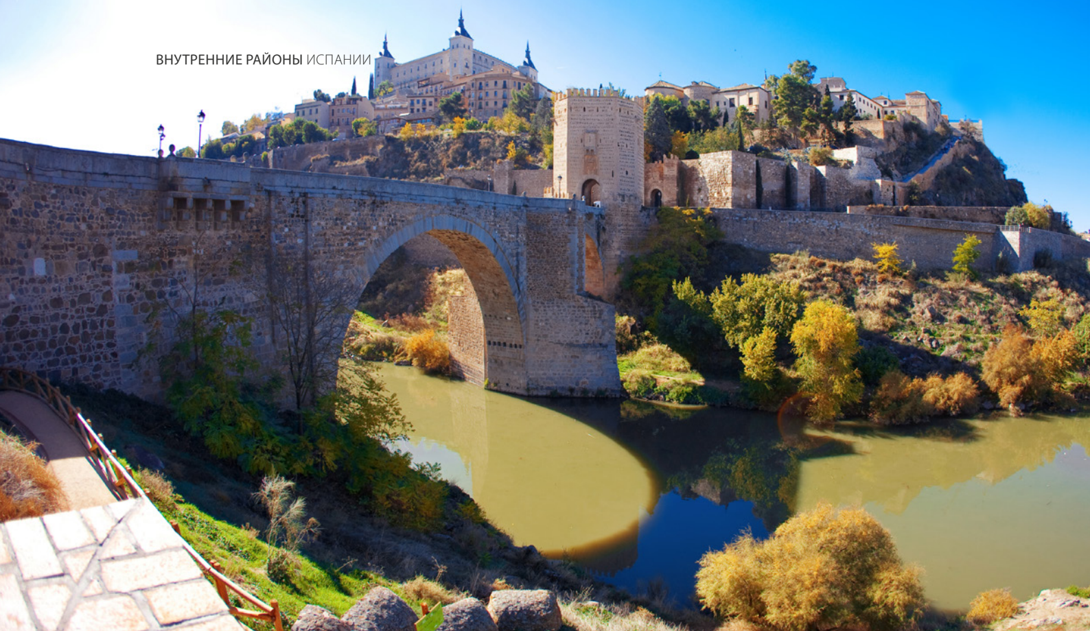
▲ МОСТ АЛЬКАНТАРА ТОЛЕДО