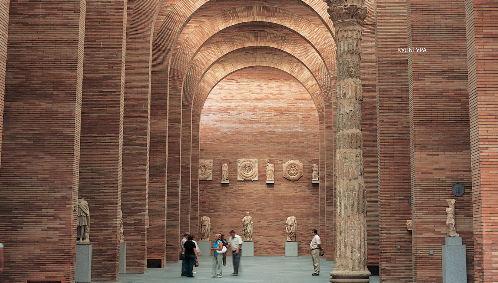
▲ НАЦИОНАЛЬНЫЙ МУЗЕЙ РИМСКОГО ИСКУССТВА МЕРИДА

В Леоне вас ждут совсем другие впечатления в одном из самых оживленных и актуальных культурных центров Испании — Музее современного искусства автономного сообщества Кастилия-и-Леон (MUSAC) . Также в Кастилии-и-Леоне вы сможете узнать все о наших истоках в Музее эволюции человека в Бургосе. Это зрелищный и современный обучающий центр демонстрирует находки, сделанные в знаменитых местах археологических раскопок в Атапуэрке .