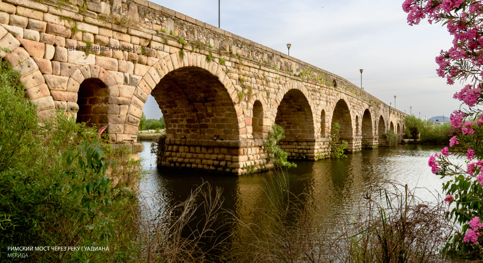
РИМСКИЙ МОСТ ЧЕРЕЗ РЕКУ ГУАДИАНА МЕРИДА

В Эстремадуре посетите старый город Касереса со средневековыми домами-крепостями, а в Мериде (Бадахос) откройте для себя бесценное прошлое римской эпохи.