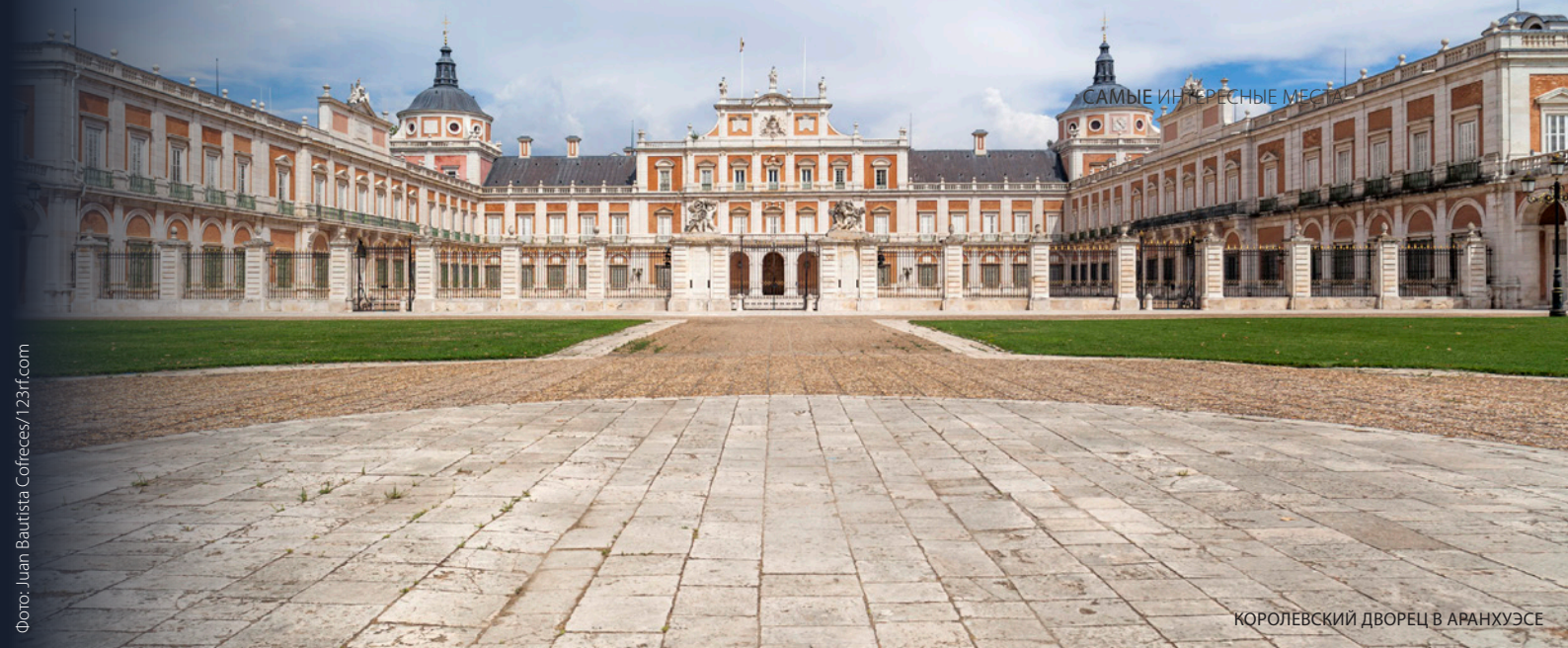
КОРОЛЕВСКИЙ ДВОРЕЦ В АРАНХУЭСЕ