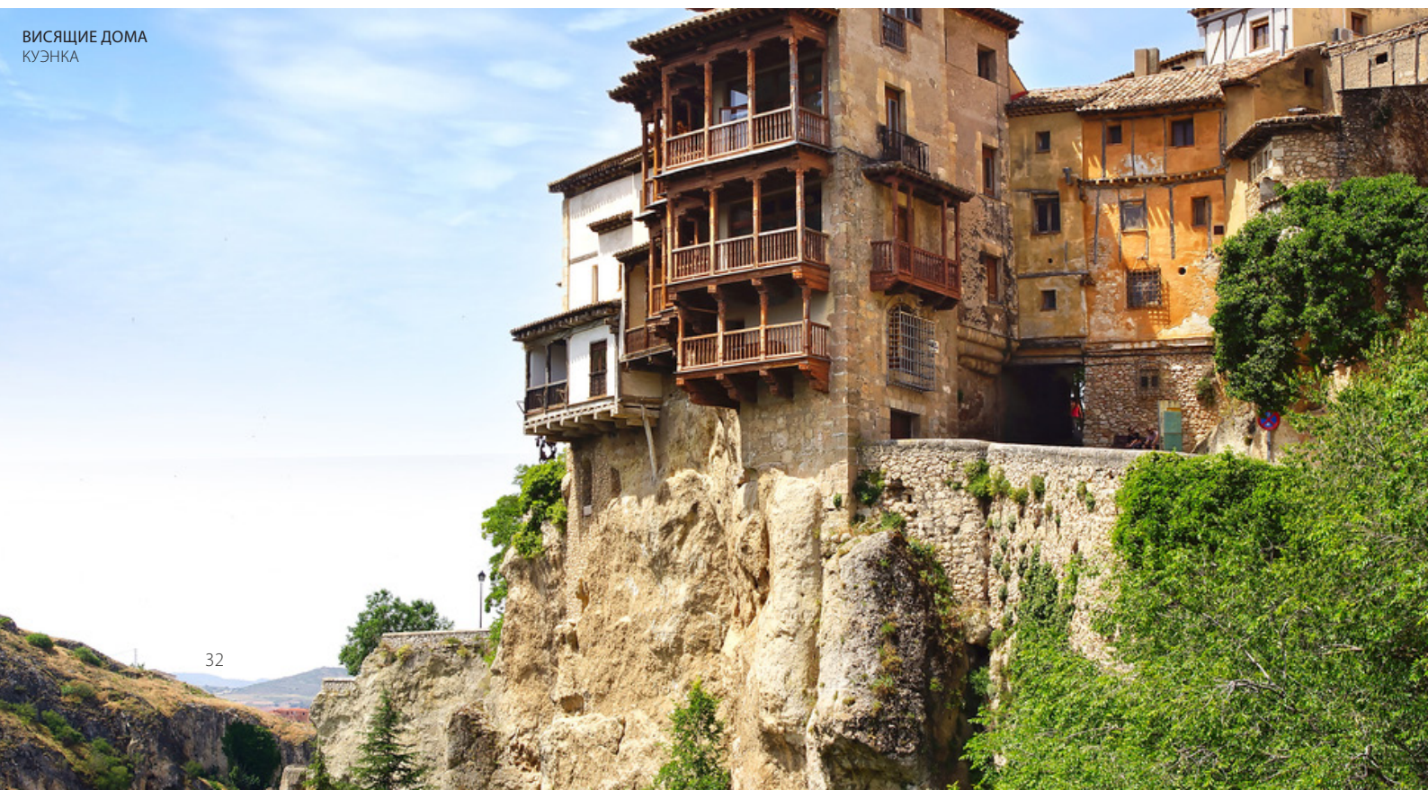
ВИСЯЩИЕ ДОМА КУЭНКА

нависают над обрывом над рекой Уэскар. Кроме того, незабываемые впечатления ждут вас в Толедо , известном как «город трех культур» благодаря уникальному архитектурному наследию, которое оставили жившие здесь христиане, арабы и евреи.