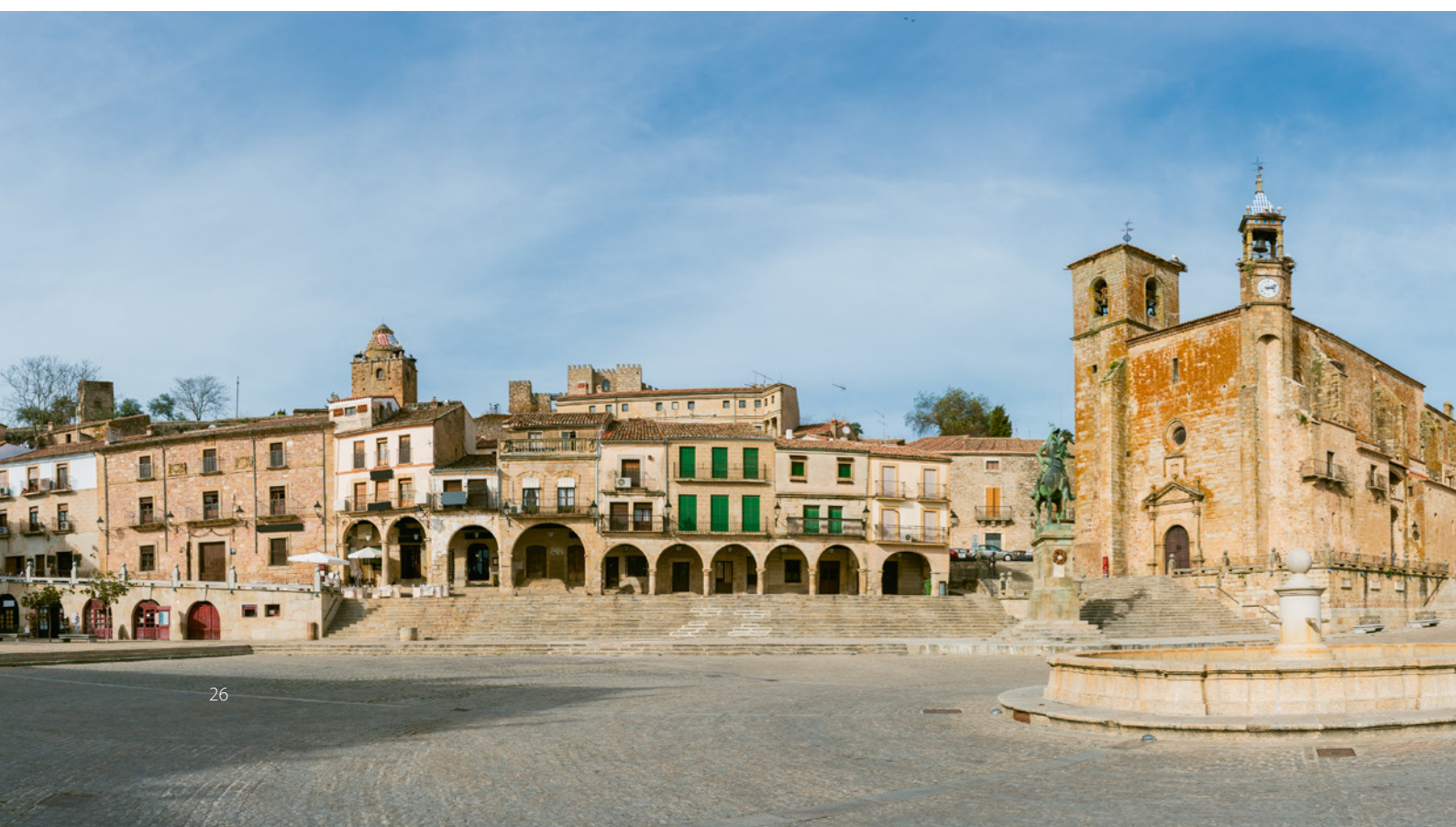
▼ ПЛОЩАДЬ ПЛАСА-МАЙОР В ТРУХИЛЬО КАСЕРЕС

Оказавшись летом в Уэске (Арагон), можно посетить два гастрономических события: День колбасок лонганиса в Граусе (в июле) и Праздник ягнятины в Серлере (в августе).