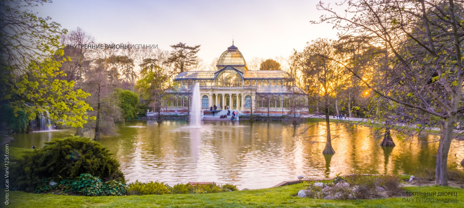
СТЕКЛЯННЫЙ ДВОРЕЦ ПАРК РЕТИРО, МАДРИД