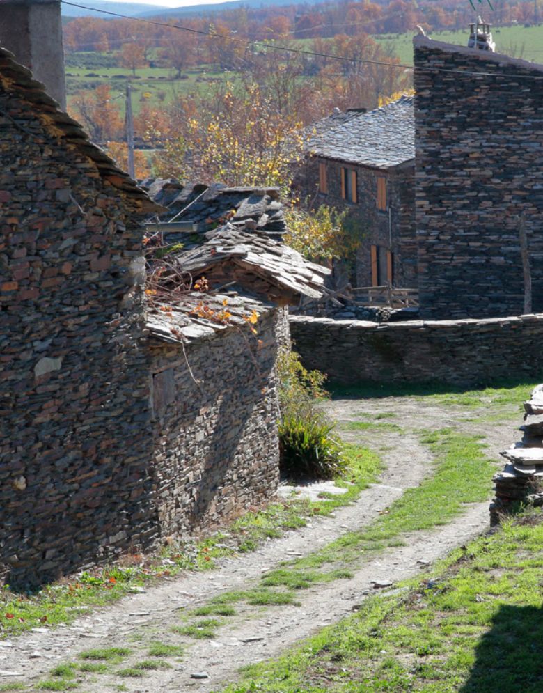
▲ КАМПИЛЬО-ДЕ-РАНАС ГВАДАЛАХАРА

протяжении веков за счет воздействия воды, ветра и льда. Гвадалахара приглашает вас познакомиться с местной природой, посетив знаменитые «черные деревни» (при их строительстве в качестве основного материала используется сланец). Столица сохраняет интересные образцы светской архитектуры, такие как Дворец герцогов Инфантадо, и религиозного зодчества, такие как иезуитская барочная церковь Святого Николая эль-Реаль.