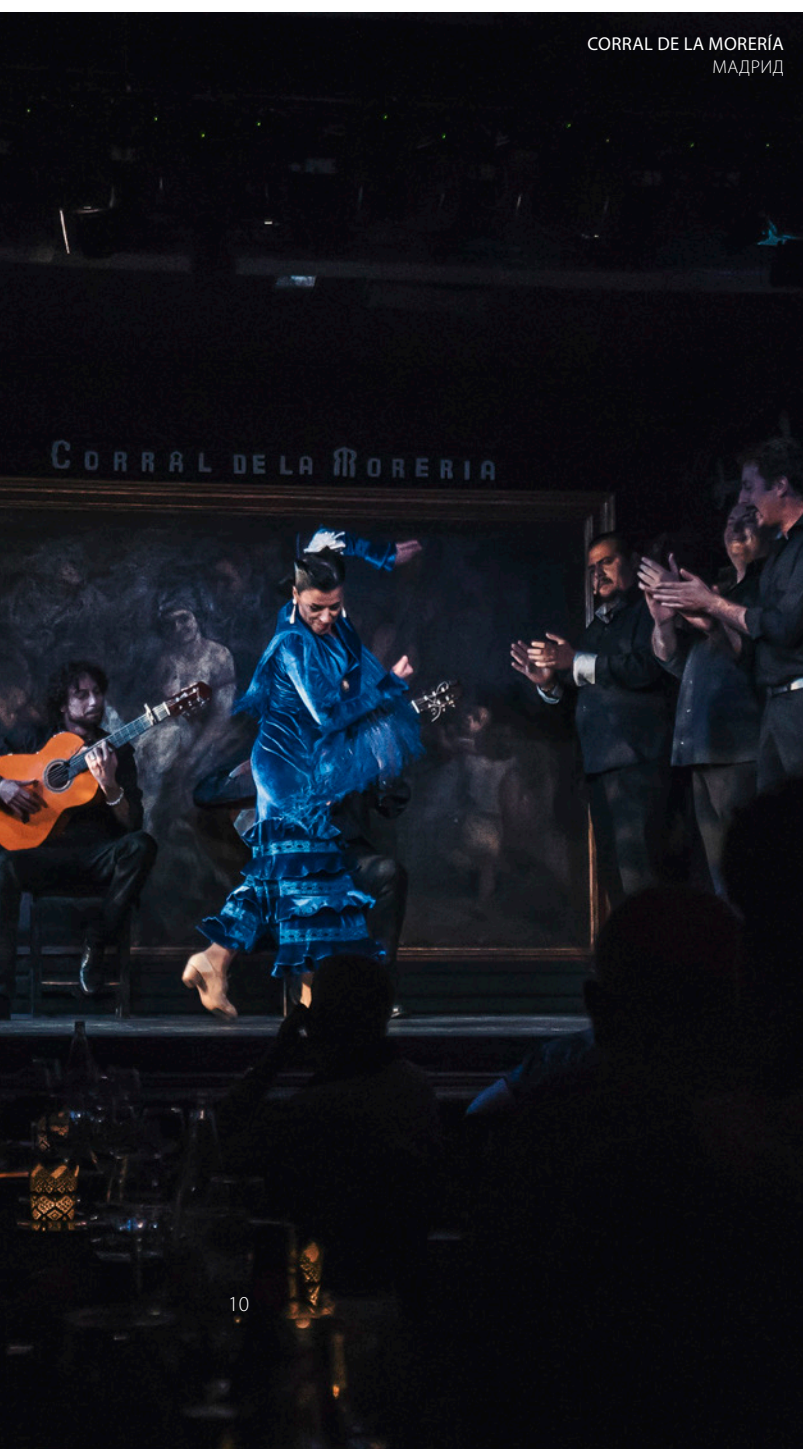
CORRAL DE LA MORERÍA МАДРИД