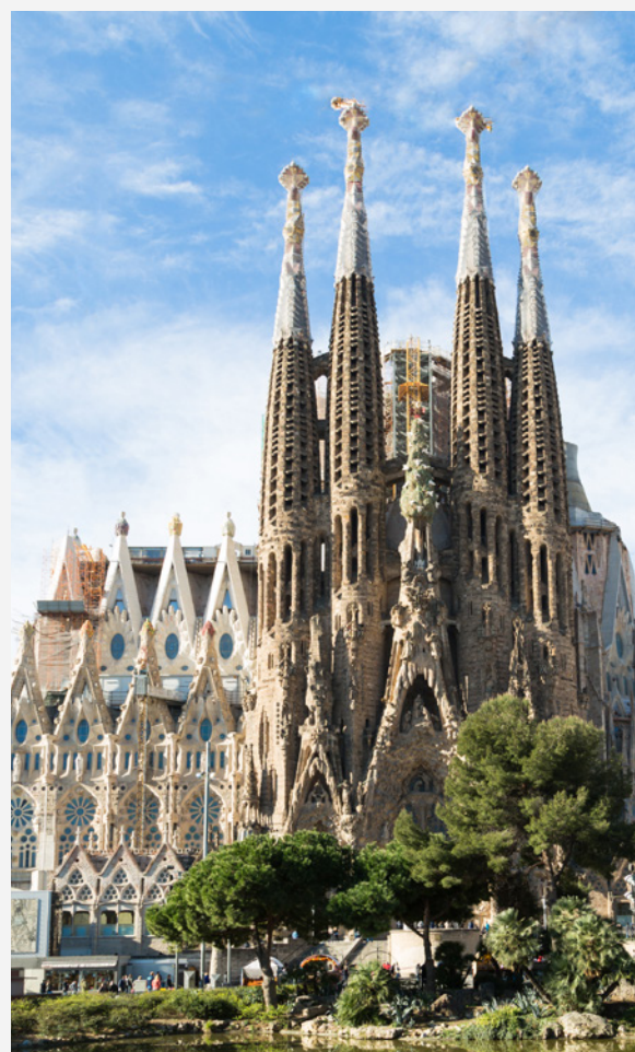
▼ ХРАМ СВЯТОГО СЕМЕЙСТВА БАРСЕЛОНА

В самом сердце Барселоны можно увидеть храм Святого Семейства — символ города и наиболее характерный образец модернизма. Ваш взгляд на творение гениального Антонио Гауди будет прикован к его остроконечным башням.