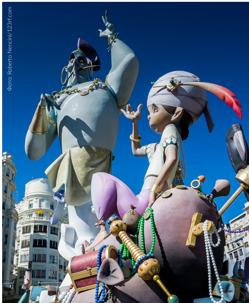
▲ ПРАЗДНИК ФАЛЬЯС ВАЛЕНСИЯ

В нескольких шагах отсюда стоит посетить Мигелете — под этим названием известна колокольня кафедрального собора Валенсии. С высоты 50 метров перед вами откроется впечатляющий вид на город.