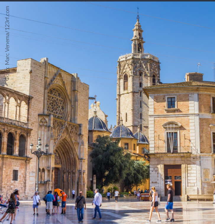
▲ КАФЕДРАЛЬНЫЙ СОБОР ВАЛЕНСИИ ВАЛЕНСИЯ