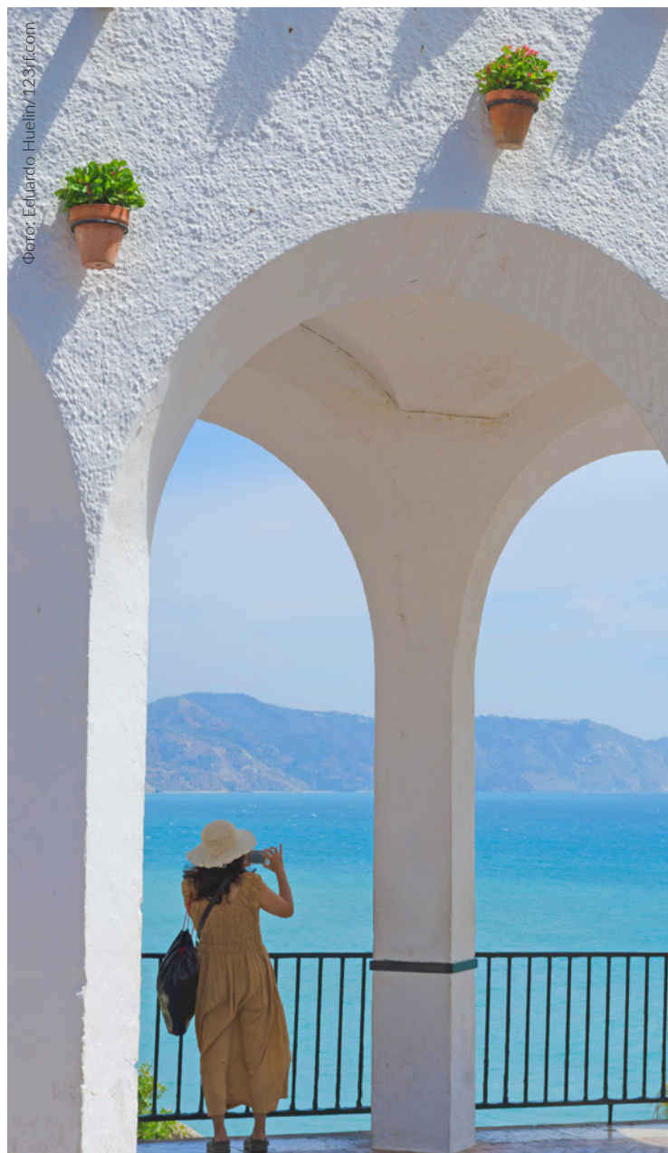
▲ БАЛКОН ЕВРОПЫ НЕРХА, МАЛАГА

Под Балконом Европы , круглой площадью над морем, которая превратилась в самое знаковое место Нерхи, можно