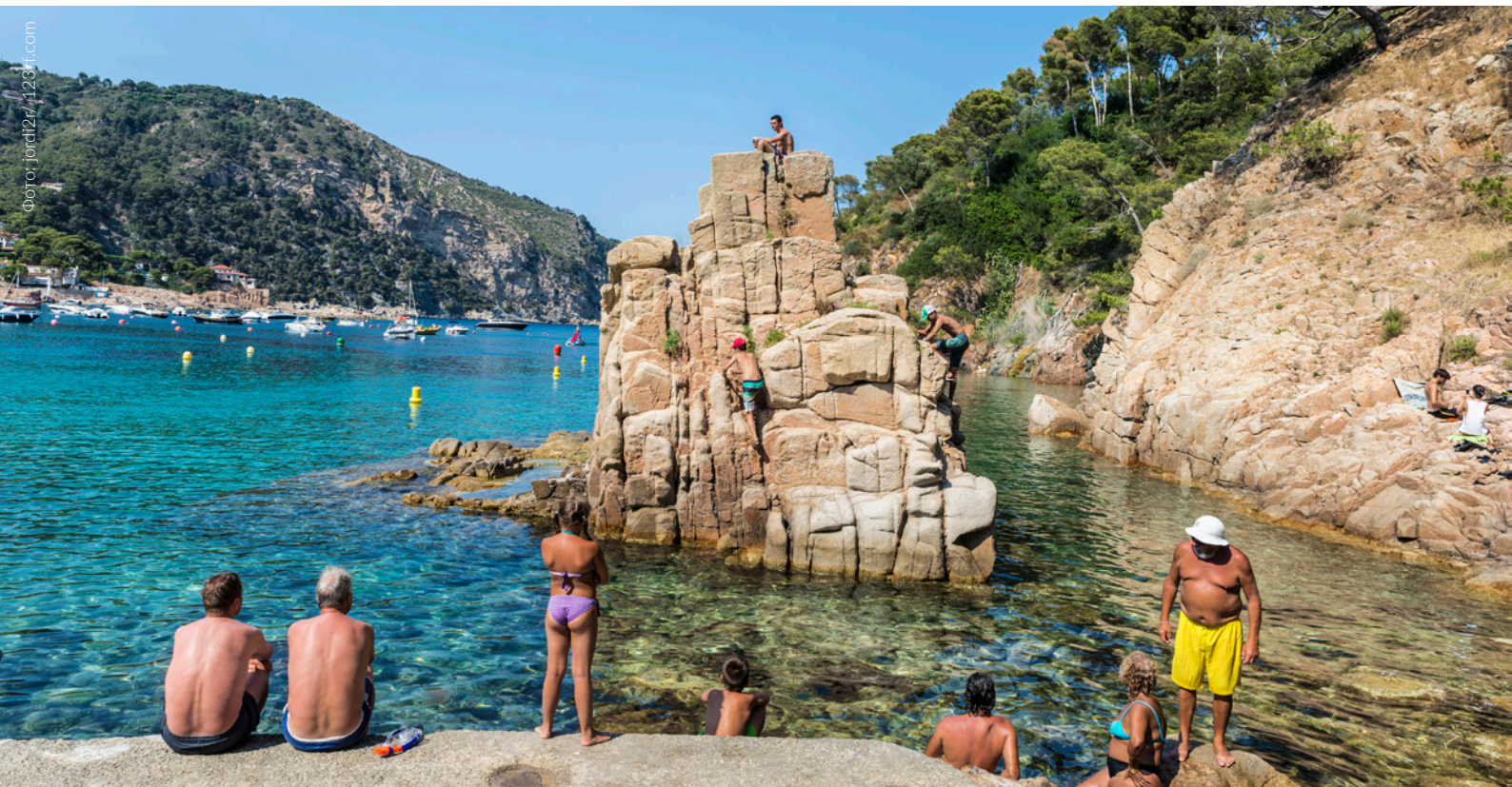
▲ ПЛЯЖ АЙГУАБЛАВА БЕГУР, ЖИРОНА

ской смотровой площадки залива Розес и исторического центра Ла-Эскалы. Совсем рядом с пляжем также находятся греко-римские руины Эмпуриеса, одного из важнейших археологических памятников во всей Испании.