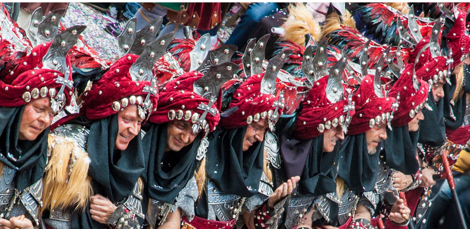
▲ ПРАЗДНИК «МАВРЫ И ХРИСТИАНЕ» АЛЬКОЙ, АЛИКАНТЕ