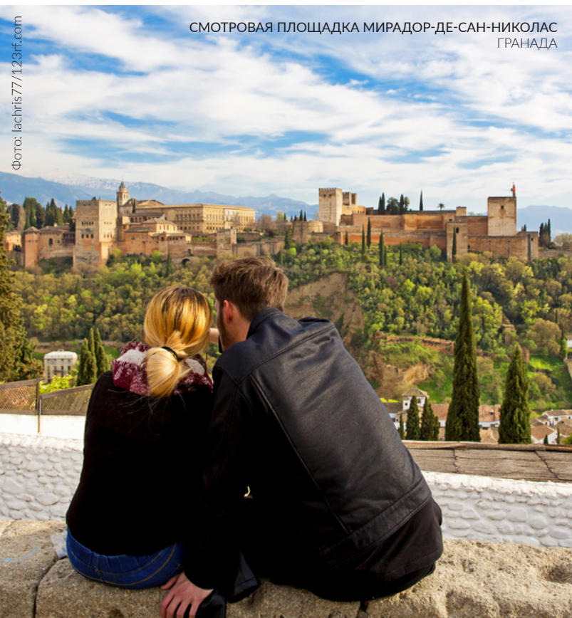
СМОТРОВАЯ ПЛОЩАДКА МИРАДОР-ДЕ-САН-НИКОЛАС ГРАНАДА

Чтобы оценить красоту архитектуры и пейзажей этого памятника Всемирного наследия ЮНЕСКО, отправьтесь на смотровую площадку Мирадор-де-Сан-Николас в квартале Альбайсин или в район Сакромонте . Отсюда вы сможете наблюдать живописную Альгамбру в окружении территории Гранады.