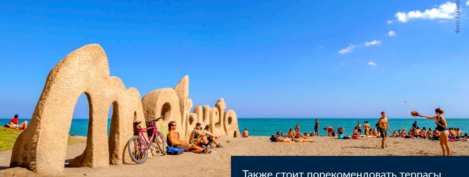
ПЛЯЖ МАЛАГЕТА МАЛАГА

Также стоит порекомендовать террасы местных баров и ресторанов, особенно вечером, когда с них можно полюбоваться незабываемым закатом.