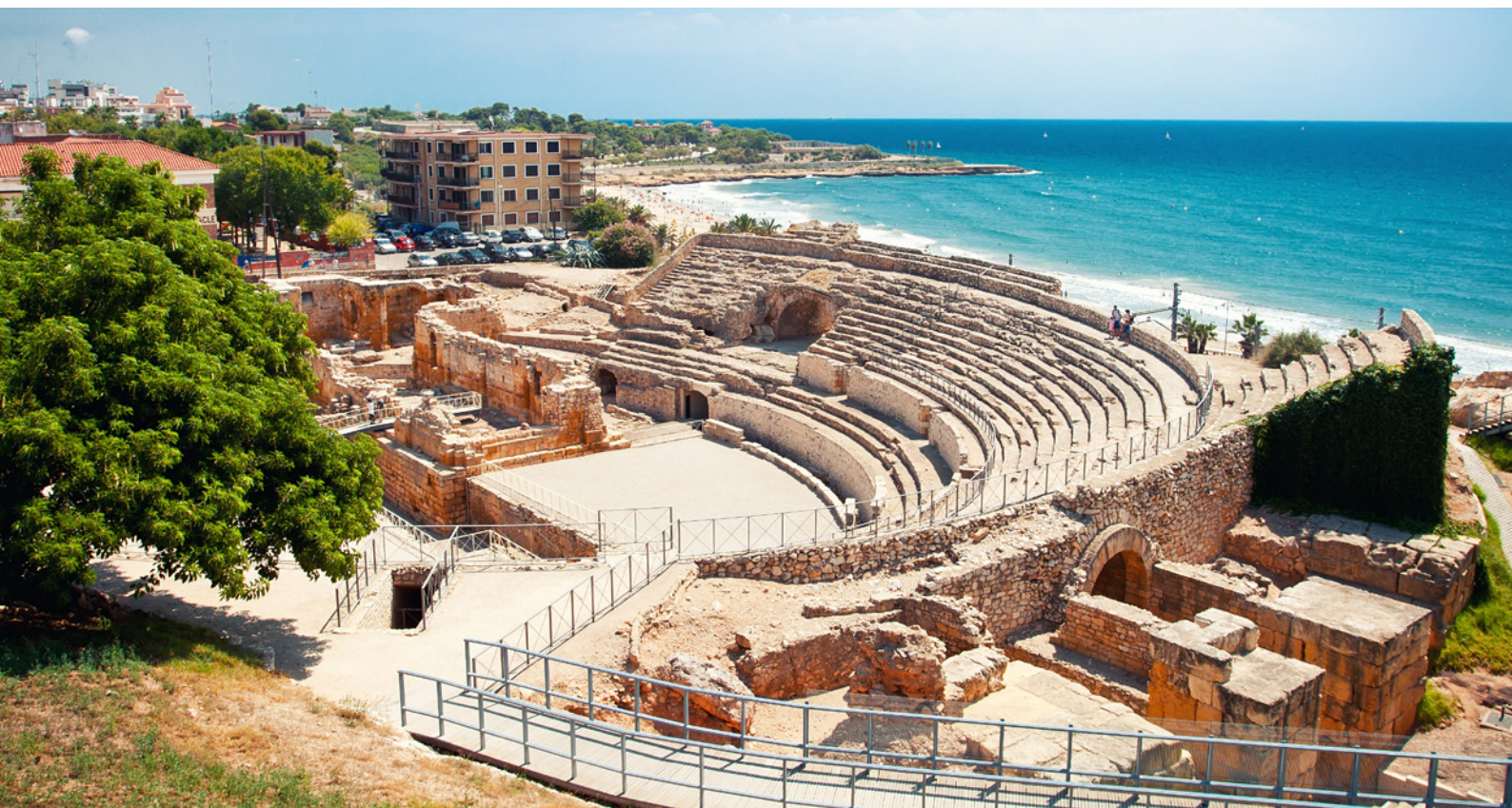
▲ РИМСКИЙ АМФИТЕАТР ТАРРАГОНА