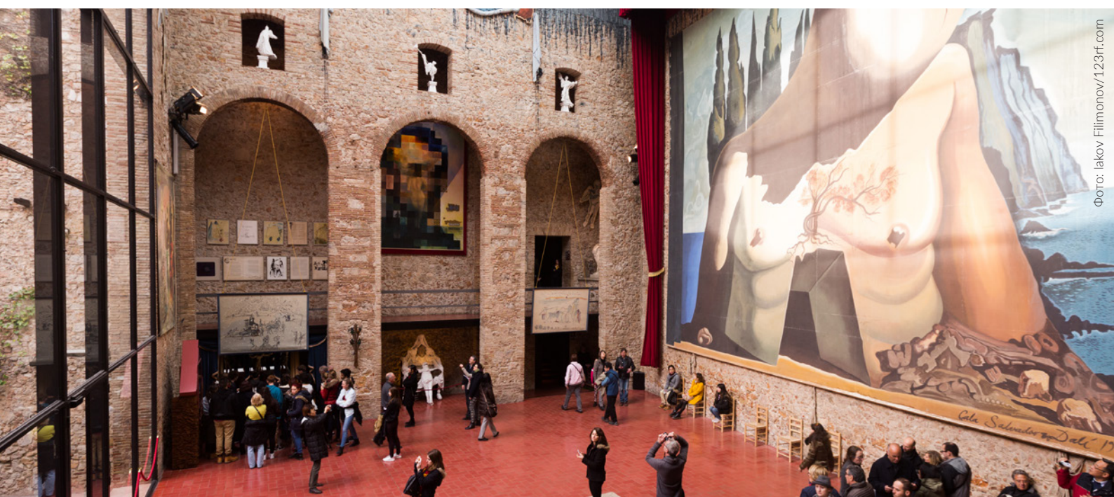
▲ ТЕАТР-МУЗЕЙ ДАЛИ ФИГЕРЕС

Помимо пляжей и хорошей погоды на всем средиземноморском побережье и в ближайших к нему городах вы сможете отправиться в путешествие по истории и культуре Испании. Исторические кварталы городов, традиционные праздники, а также музеи и памятники помогут вам почувствовать истинный дух Средиземноморья. Предлагаем вам несколько идей, которые помогут насладиться путешествием.