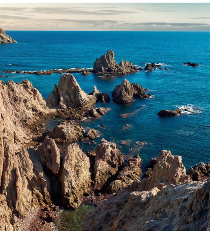
▲ ПРИРОДНЫЙ ПАРК КАБО-ДЕ-ГАТА АЛЬМЕРИЯ