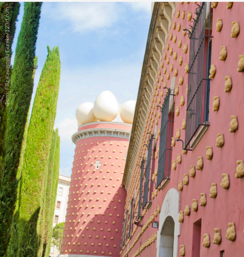
▲ ТЕАТР-МУЗЕЙ ДАЛИ ФИГЕРЕС

Среди прекрасных пейзажей Кадакеса находится небольшой приморский городок Портлгигат, где можно посетить дом-музей Дали — рыбацкую постройку, в которой художник провел несколько продолжительных периодов своей жизни. В мастерской вы сможете увидеть рабочие инструменты, а снаружи здания — многие сюрреалистические творения художника.