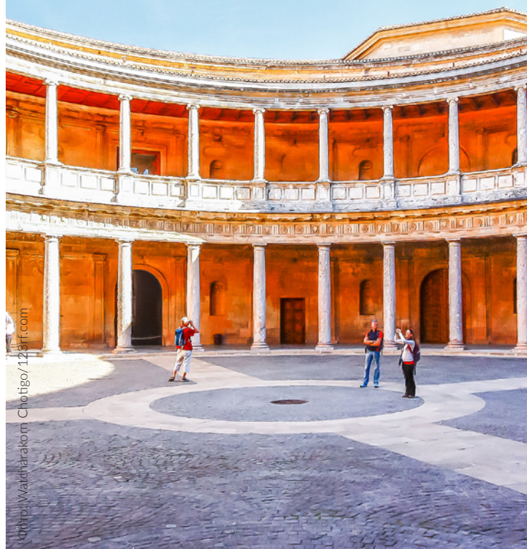
▲ ДВОРЕЦ КАРЛА V ГРАНАДА

Ни одно посещение Гранады не может обойтись без знакомства с Альгамброй , которая на протяжении своей истории была дворцом, цитаделью и крепостью, а сейчас является одним из важнейших объектов художественного наследия во всей Испании.