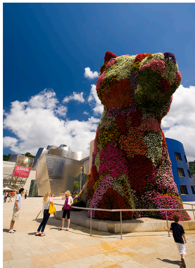
▼ МУЗЕЙ ГУГГЕНХЕЙМА В БИЛЬБАО

11 октября, в день Девы Марии Бегоньи проходит оживленный праздник с концертами, шествиями, мероприятиями для детей, танцами и сельскими видами спорта Страны Басков. От площади Пласа-де-Унамуно начинается лестница с большой историей под названием