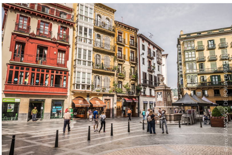
▲ СТАРЫЙ ГОРОД

В районе «Семи улиц» можно обнаружить и другие знаковые места, такие как церковь Сан-Антон , готическое здание XV века (под ее алтарем можно увидеть остатки первоначальной крепостной стены Бильбао) и историческое здание Ла-Больса — дворец XVIII века, превращенный в общественный и культурный центр.