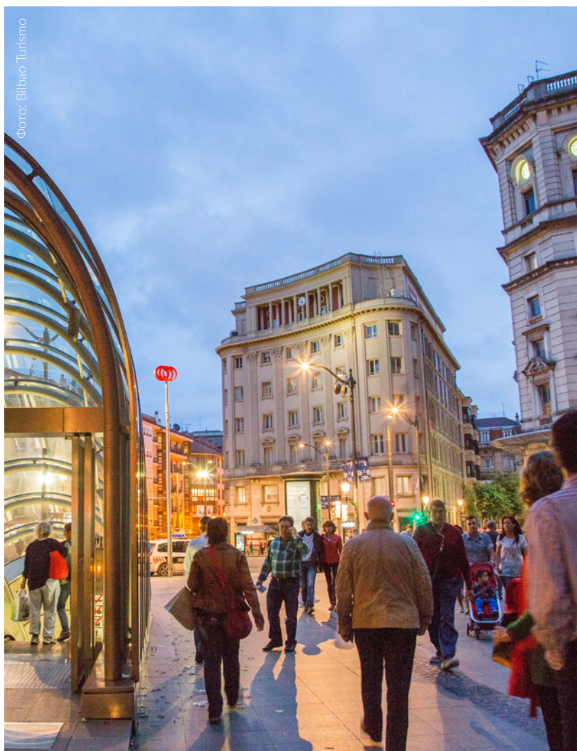
▼ ПЛОЩАДЬ ПЛАСА-СИРКУЛАР

Здесь можно прогуляться по квадратам широких улиц, соединяющимся в таких местах, как площадь Пласа-Сиркулар. Здесь находится монументальное здание Общества Бильбао в эклектичном стиле с изысканной внутренней отделкой в английском стиле. Оно является резиденцией самого элитного и эксклюзивного клуба Бильбао. Продолжив