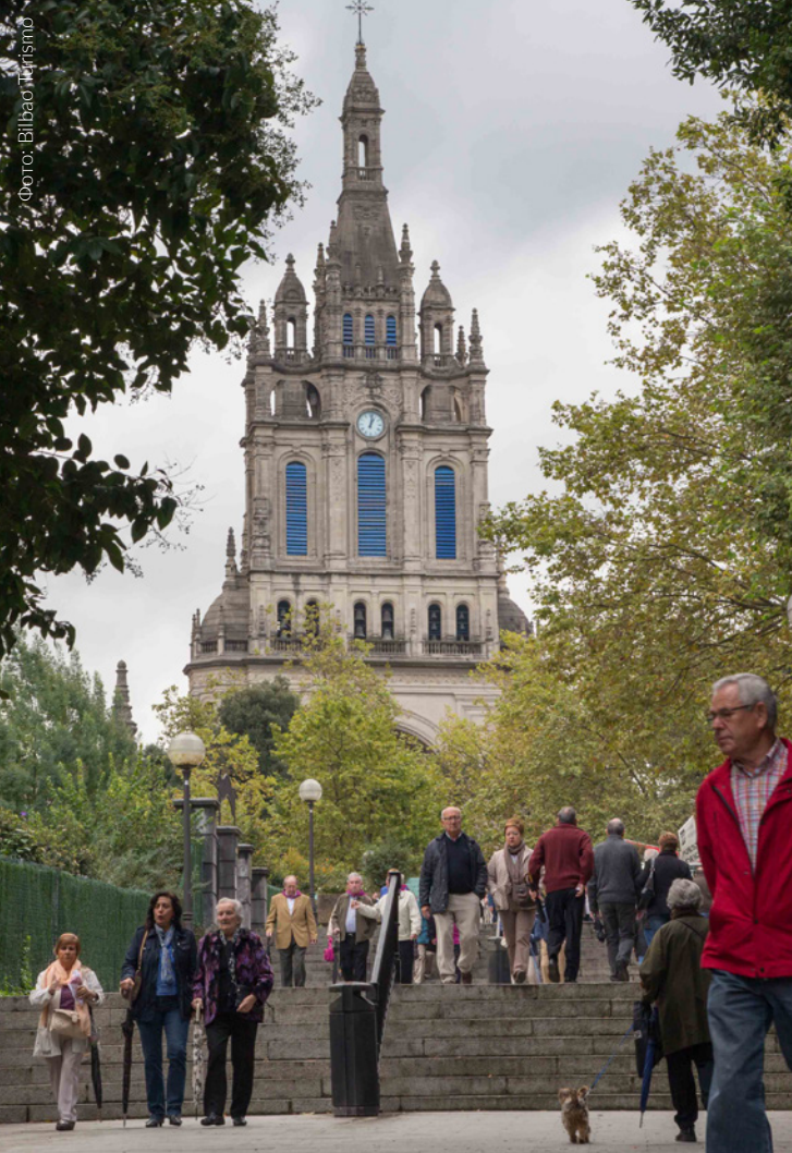
▲ БАЗИЛИКА ПРЕСВЯТОЙ ДЕВЫ БЕГОНЬЯ