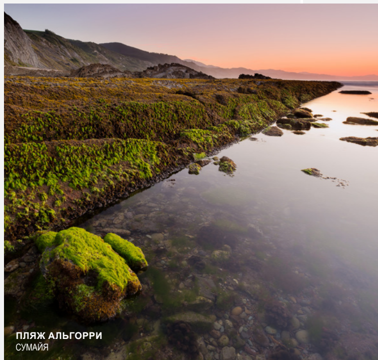
ПЛЯЖ АЛЬГОРРИ СУМАЙЯ

Вы можете проехать 60 километров побережья провинции Гипускоа и взглянуть с высоты ее громадных обрывов на Атлантический океан. Загляните в небольшие рыбацкие поселки, чтобы искупаться на их пляжах и попробовать местные блюда морской кухни. Или посетите геопарк Коста-Баска, территорию между побережьем Бискайского залива и баскскими горами, образованную муниципалитетами Мутрику, Деба и Сумайя.