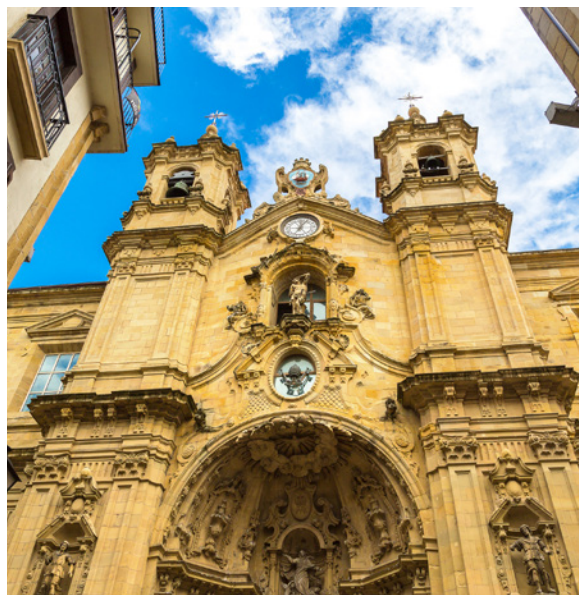
▲ ЦЕРКОВЬ САНТА-МАРИА ДЕЛЬ КОРО

Затеряйтесь в романтическом квартале среди строений в стиле Прекрасной эпохи и зелёных пешеходных зон. Вы сможете полюбоваться кафедральным собором дель-Буен-Пастор (Доброго Пастыря), театром Виктории-Евгении и зданием городского совета, в котором находилось большое городское казино до запрета азартных игр в 1924 году.